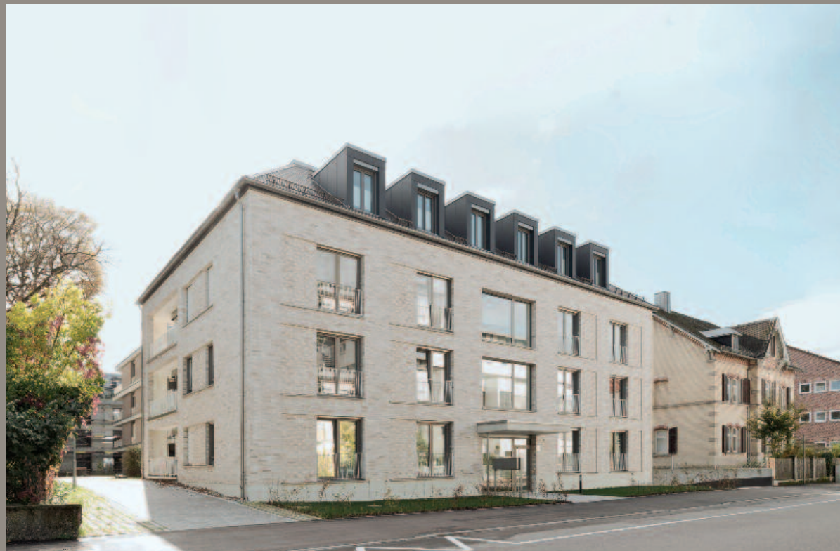
Mörikepark Schwäbisch Gmünd 22 Stadtwohnungen, Fertigstellung 2019