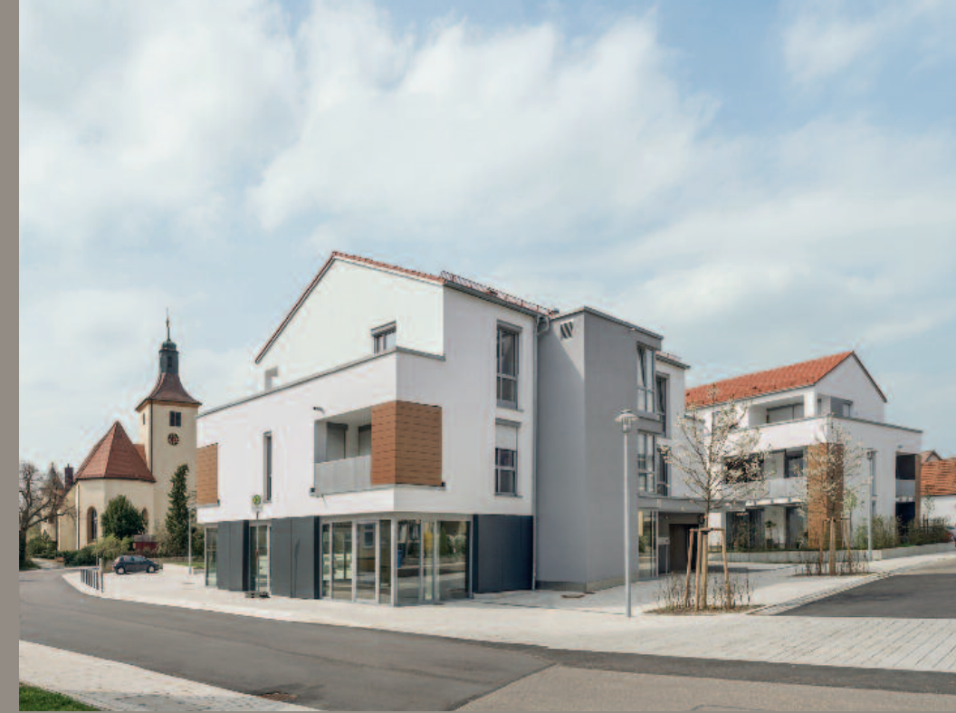
Ortsmitte Essingen 25 Wohnungen, Fertigstellung 2019