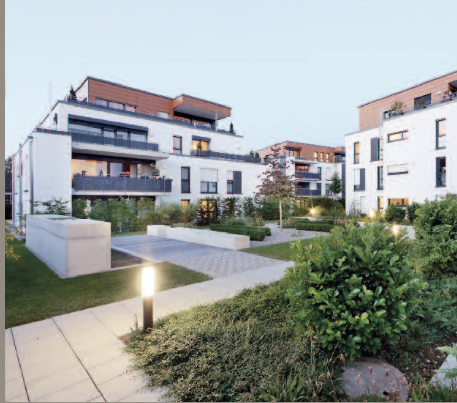
Wohnen am Rechbachweg Waldstetten 55 Wohnungen, Fertigstellung 2015

Hier sehen Sie, was wir bauen. Eine Auswahl fertiggestellter Projekte.